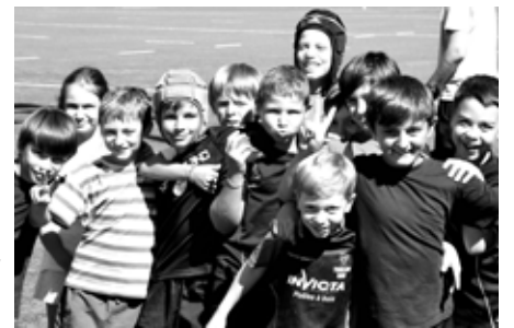
les jeunes du PARC !